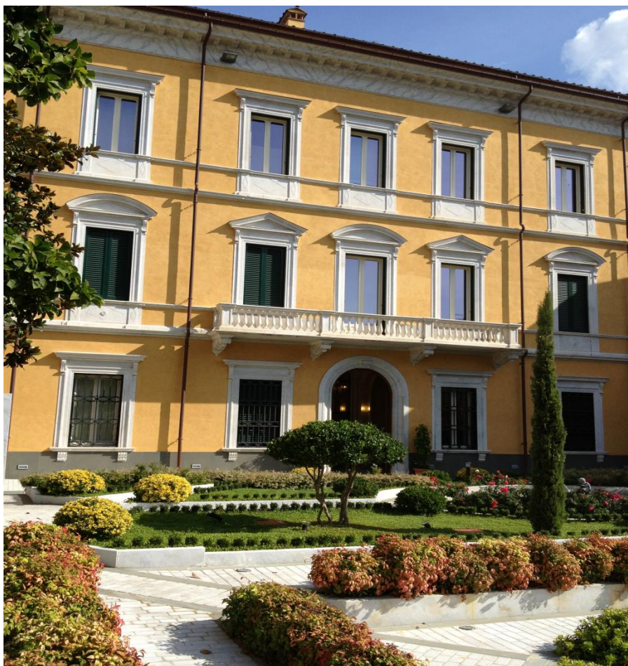
Vista dal giardino interno